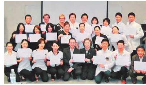
▲スターク校長から修了証が授与

スターク校長から修了証が授与され、また、ビューティ学科長のグニエル先生からは親交の証としてプレゼントまで頂戴いたしました。さらにその後、懇親会が開かれましたが、内容の濃いハードな研修が終わったこともあってか、皆さんの顔には笑顔と達成感がにじみ出ていました。また、AIASの校長先生や講師の方々から「日本のセラピストのすばらしい技術を知ることができ、また、オーストラリアの技術も知っていただくことができました。日本とオーストラリアの交流を深めていきたいと思います」と、温かいメッセージをいただきました。学校が休職中であつたにもかかわらず、この学術交流会を成功させるためにさまざまな準備と心温かいおもてなしを提供してくださったAIASの皆さまには本当に感謝の気持ちでいっぱいでした。また、日本から参加していただきました皆さまも、大変お疲れさまでございました。今回はさらに充実したプログラムになるようAIAS-JAPANは奮闘いたします。